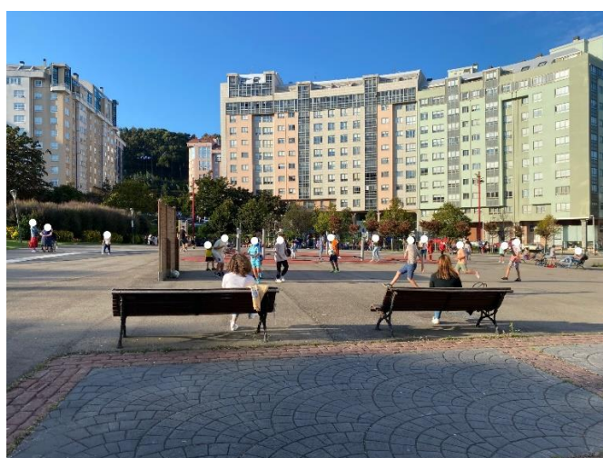
Pared de madera que hace las veces de campo de fútbol en Plaza Elíptica

Uno no puede dejar de mirar con cierta envidia instalaciones públicas como las que disfrutan en otros barrios de la ciudad para que sus jóvenes puedan practicar deporte al aire libre. Instalaciones como las de la Plaza de San Pablo, las del vecino barrio de Labañou o la Plaza de la Tolerancia (en construcción).