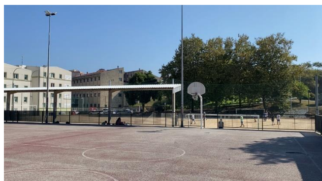
Pistas de Labañou (4 canastas y 6 porterías de fútbol grandes)