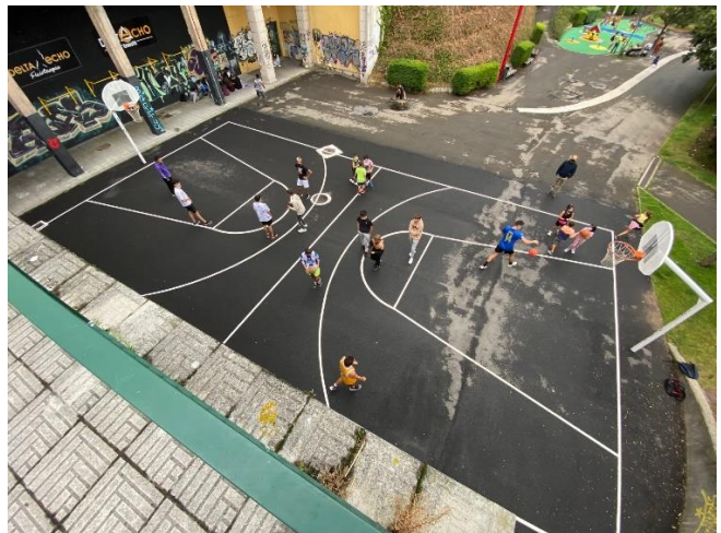
Pista de básquet en Plaza Elíptica (2 canastas)